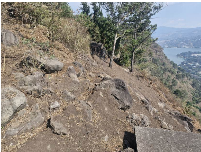
Foto 8: Estado actual de acequias en reduciendo erosión en brechas cortafuego

Se llevará acabo en mayo, cuando inicie la temporada lluviosa, con el objetivo de aprovechar la humedad del suelo para que sea más fácil dar mantenimiento a las acequias.