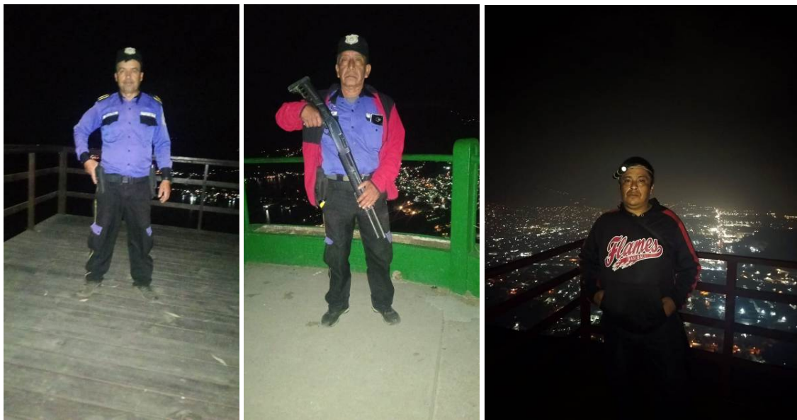
Foto 9, 10 y 11: Personal de vigilancia para prevención de incendios forestales las 24 horas del día.

Activamos nuestro sistema de vigilancia contra incendios. Actualmente el personal de seguridad realiza patrullajes de rutina en los cuales verifica la ausencia de cualquier situación de riesgo desde los 3 miradores del parque.