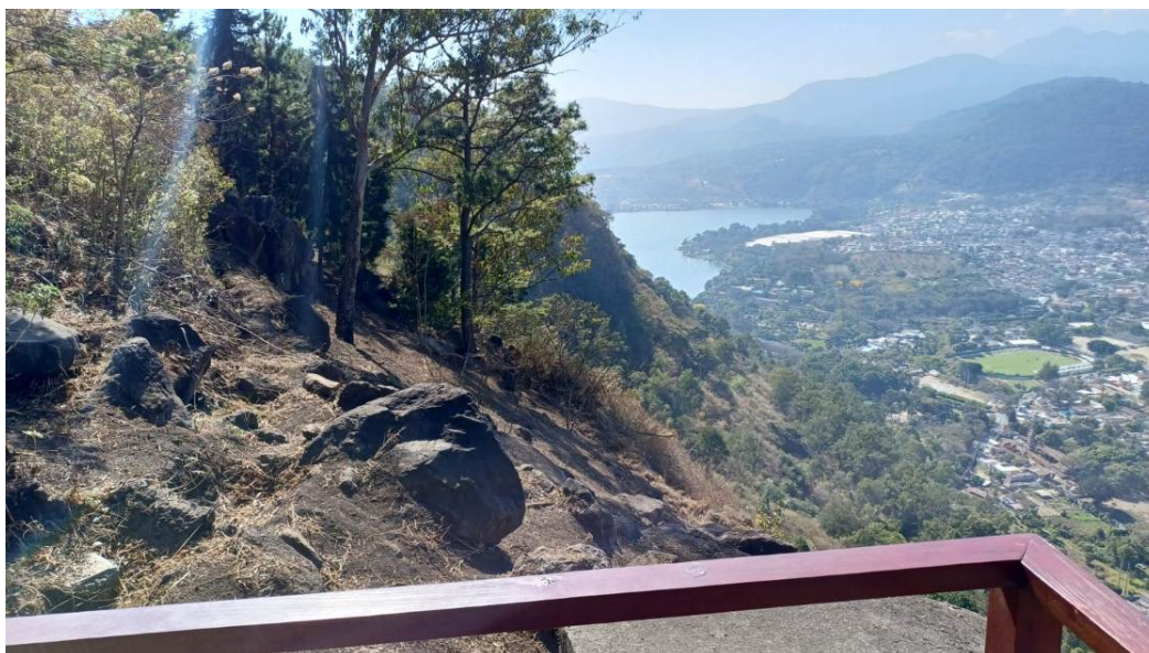
Foto 1: Trabajos de mantenimiento del sistema de brechas cortafuegos.

Se han incluido dentro del plan de control y vigilancia el monitoreo semanal con dron lo cual nos ayudará a realizar observaciones de ilícitos de manera indirecta sin exponer al personal guardarecursos en campo.