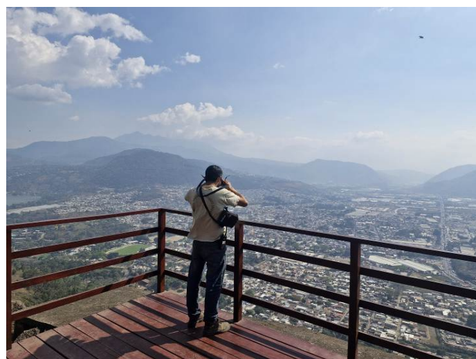
Fotos 2 y 3: También se inició con puestos de control y vigilancia permanentes en miradores principales del parque.