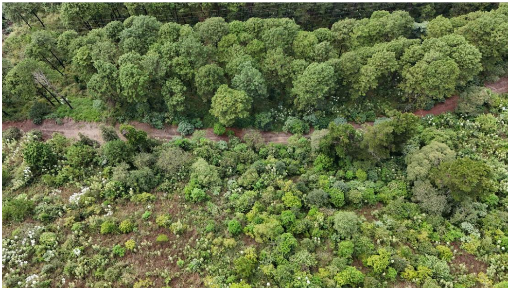
Fotos 4 y 5: Vista aérea de zona de recuperación con brechas cortafuegos